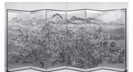
関ヶ原合戦図屏風