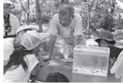
ハリヨを観察する子どもたち

市は、子どもたちに環境への取り組みや自然の現状を知ってもらい、環境に対する意識を高めるため、「夏休み水と緑の探検隊2019」を開催します。