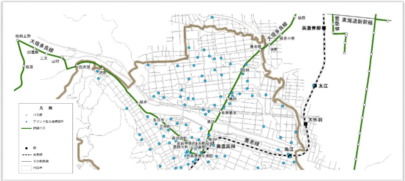
現行の公共交通路線網図（大垣多良線）