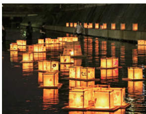
水門川万灯流し（昨年の様子）

OKB大垣共立銀行本店17階のスカイラウンジ特別開場 3日 10:00~17:00 地上60メートルからの眺望をお楽しみください。