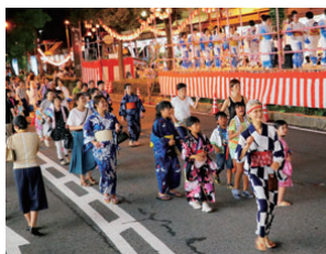
大垣おどり大会（昨年の様子）