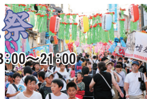
にぎわう祭り会場

墨俣の夏の風物詩として、古くから「お天王さん」と呼ばれ親しまれている「すのまた天王祭」。当日は、多彩な催しが行われ、祭りムードを盛り上げます。