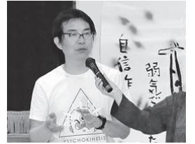
俳句の情景を即興でアートにするキムさん