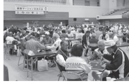
交流大会(過去の様子)

ねんりんピック岐阜2020大垣市実行委員会は、同大会において大垣市で開催する「健康マージャン交流大会」のリハーサル大会に参加する人を募集します。