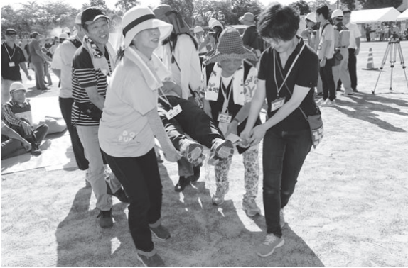
防災訓練の様子(昨年)

市は、市民一人ひとりが災害への対応を身につけるとともに地域ぐるみで防災力を高めるため、毎年、総合防災訓練を行っています。