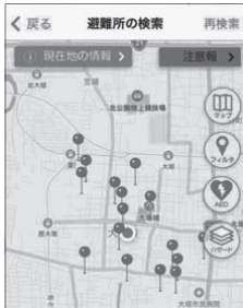
GPSで現在地から避難所までのルートを検索

AppStoreまたはGooglePlayにて、「全国避難所ガイド」で検索しダウンロードできます