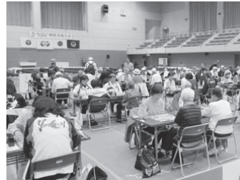
囲碁交流大会(過去)の様子