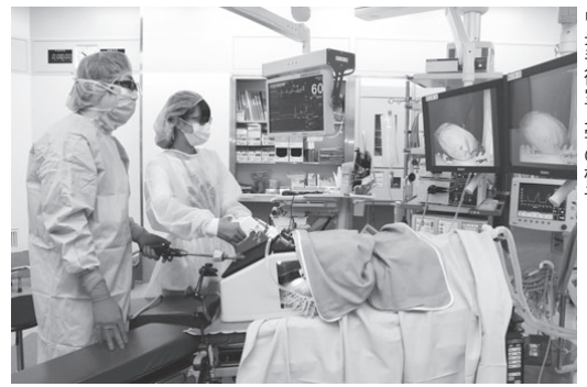
中央手術室見学の様子

8月17日、中学・高校生52人が参加して、第3回市民病院バックヤードツアーが開かれました。この催しは、地元の市民病院を知り、医療人を目指すきっかけづくりになればと開催。参加者は、医師や看護師とともに、手術室や救命救急センター、薬品管理室などを巡り、さまざまな職種のスタッフから説明を受けました。生徒たちは、院内の見学のほか、屋上ヘリポートで待機する県防災ヘリに乗り込んだり、最先端の手術機器に触れたりする＝写真＝など、初めて見る病院の舞台裏に驚いていました。