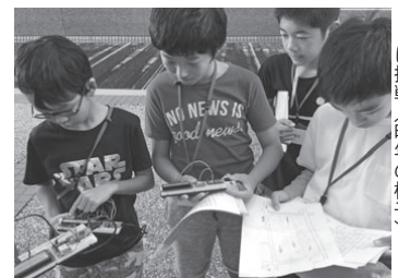
位置情報を使ってなぞ解きに挑戦（昨年の様子）