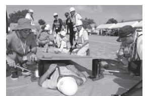
（総合防災訓練 昨年の様子）

中川地区で開催された総合防災訓練の様子や災害時・避難時の注意点のほか、来年1月に開庁する新市庁舎の防災対策について紹介する。