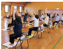
エクササイズの様子