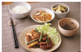
アスパラと豚肉のオイスターソース炒め定食(タニタ食堂のメニュー)