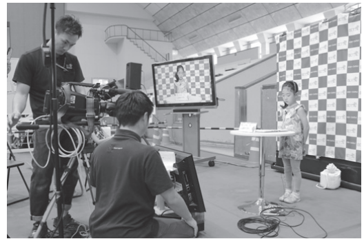
アナウンサーの仕事体験の様子

小学生がさまざまな仕事を体験するイベント「キッズワークエキスポinおおがき」が8月31日と9月1日の2日間、大垣城ホールで開催されました。