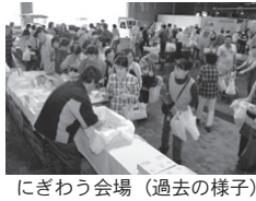
にぎわう会場（過去の様子）