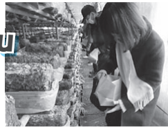
しいたけ収穫体験の様子

上石津まちづくり協議会は、田舎で自然と歴史を満喫できる、宿泊ツアーを開催します。