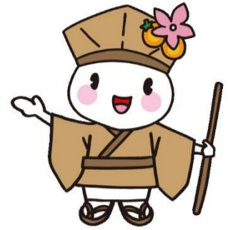
大垣市マスコットキャラクター おがつきい