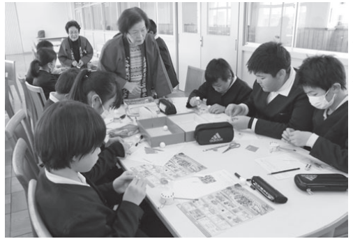
つりびな作りを体験する子どもたち (墨俣小学校)