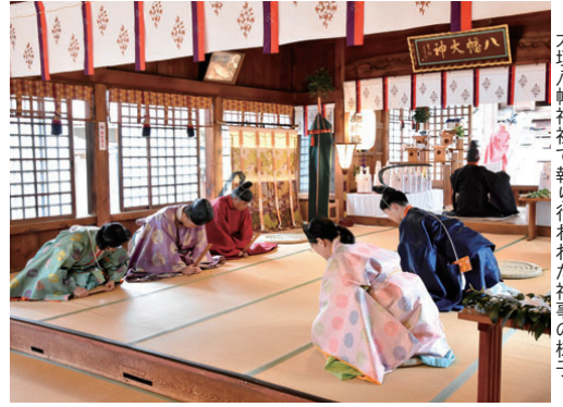
大垣八幡神社で執り行われた神事の様子

13両の軸が城下町を巡行し、初夏の訪れを告げる大垣まつり。今年は、5月9・10日に開催が予定されていましたが、新型コロナウイルス感染防止のため軸行事を中止するなど、神事のみ規模を縮小して大垣八幡神社で執り行われました。