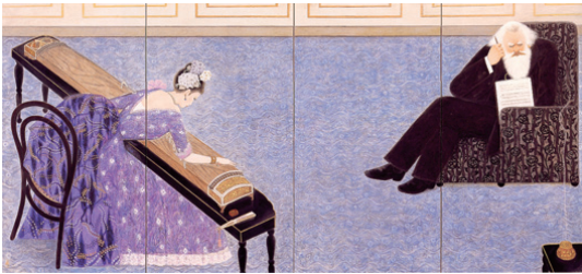
作品「ウィーンに六段の調(ブラームスと戸田伯爵極子夫人)」