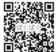
「ばくばくキッチン」