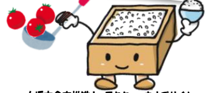
大垣市食育推進キャラクター ますごめくん