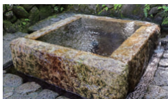
市内各地に湧き水が点在している(写真:加賀野八幡神社井戸)

「都市データパック」編集部(東洋経済新報社)が公表している「住みよさランキング2020」において、全国81市区のうち、本市が総合27位となりました。昨年の55位からランクを上げ、県内で唯一トップ50位以内に入りました。 ランキングは、「安心度」「利便度」「快適度」「富裕度」の4部門の視点から、人口当たりの病床数や、飲食店数、気候、1住宅当たり延べ床面積など20の指標を基に偏差値を算出して付けられます。 4部門の中で、最も順位が高かった「快適度」では、指標の一つである1か月の水道料金が全国26位となっています。水の都として、豊富で良質な地下水に恵まれ、水道料金が低く抑えられています。 次に高いのが「富裕度」で、産業都市らしく財政力指数や人口当たりの法人市民税、納税義務者1人当たりの所得が比較的高くなっています。 「利便度」においては、人口当たりの小売店舗面積が広く、小売販売額も多くなっています。 「安心度」の部門が低くなっていますが、算出指標によって評価が分かれています。子育て支援分野では、高校生まで通院・入院ともに医療費が無料になることが高く評価されている一方、刑法犯認知件数の評価が低く、自転車盗難などの犯罪は減少傾向ですが、被害の多さが影響していると考えられています。新型コロナウイルス感染症の影響で有効求人倍率が低下傾向にあり、経済対策と同時に治安対策も必要です。 市民の皆さんが安全に安心して快適に暮らすことができる住みよいまちづくりの一層努力、若者が集まり、子育てしやすいまちを目指します。