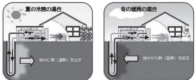
地下水利用地中熱ヒートポンプのしくみ