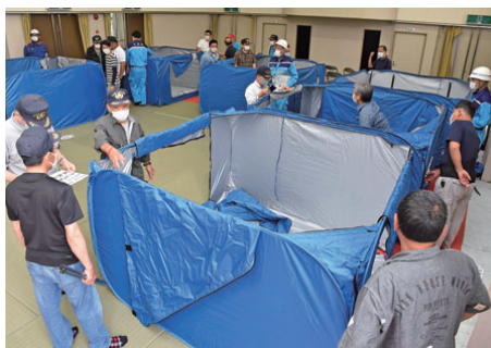
折り畳みテントで避難所内に仕切りを設置

訓練では、感染リスクに対応した居住スペースを確保するため、折り畳みテントで仕切りを設置したほか、事前受付で検温と健康チェックを実施し、発熱などの症状がある場合は専用エリアへ誘導しました。