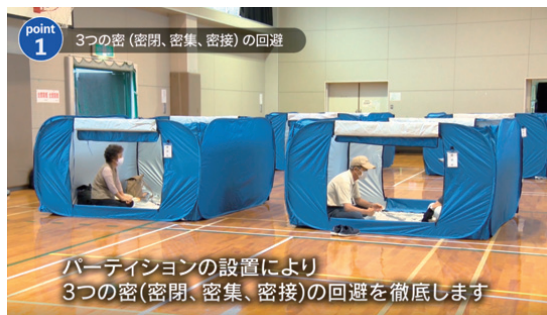
感染リスクに対応した避難所運営を紹介する動画の一場面