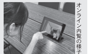
オンライン内覧の様子

空家の利用希望がある人は現地内覧またはオンライン内覧ができます。お気軽にご利用ください。