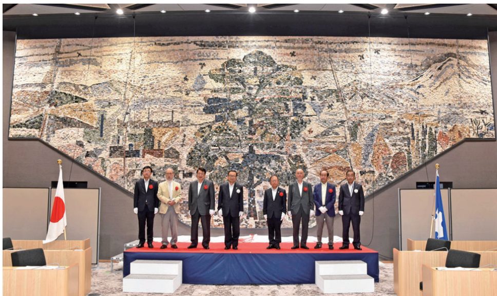
新庁舎議場でお披露目されたモザイク壁画「西濃の四季」