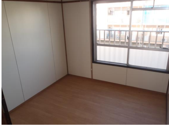
和 室 ①