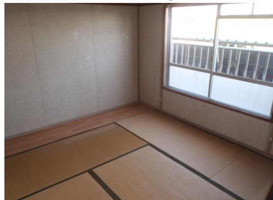
和 室 ②