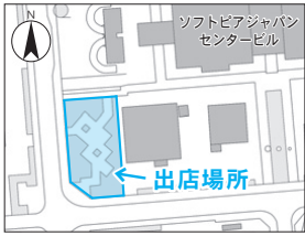
追加した区域の位置図

テイクアウト販売を実施しています。 実施日は、月～金曜日(祝日除く)の午前11時から午後2時までで、13店舗のキッチンカーが日替わりで出店しています。※荒天時は中止 詳しくは、市HPまたは都市計画課(☎47-8698)へ。