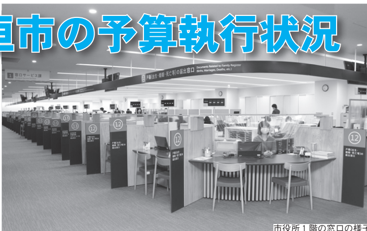
市役所1階の窓口の様子