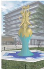
シンボルモニュメント「翔」