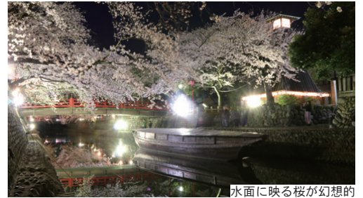
水面に映る桜が幻想的

3月27日から4月11日まで、奥の細道むすびの地記念館周辺で「春まつり」が行われます。期間中の毎日、午後6時から桜のライトアップが行われるほか、軽食などが楽しめる移動販売車も出店します。