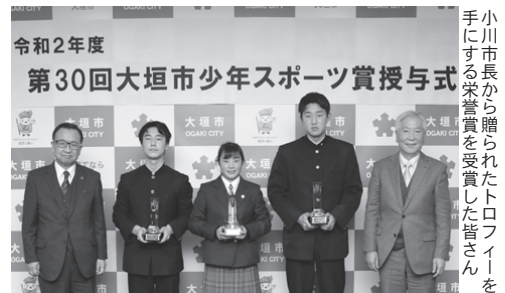
小川市長から贈られた栄誉賞を受賞した皆さん