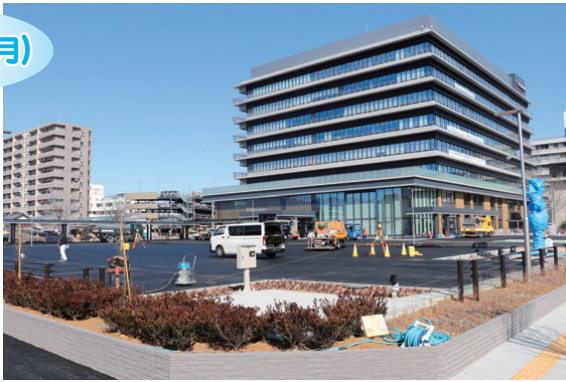
完成に向け整備が進む第1来庁者駐車場

庁舎南に整備を進めてきた第1来庁者駐車場が、3月29日(月)から利用できるようになります。