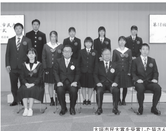
大垣市民大賞を受賞した皆さん