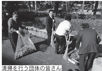
清掃を行う団体の皆さん