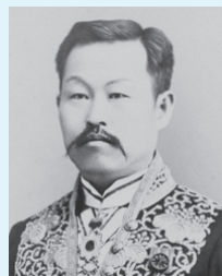
松本荘一郎肖像(奥の細道むすびの地記念館蔵)