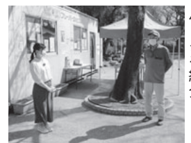
大垣公園ではプレーパークを紹介

心地よい春の陽気の中、市街地を散歩しながら家族みんなで楽しめる施設や体験教室を紹介する。