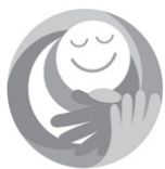
Ogaki CITY 障がい者サポーター制度シンボルマーク