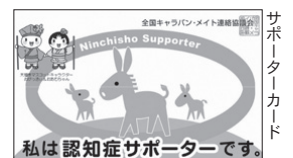
私は認知症サポーターです。