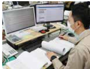
法令等を基に建築審査

建築関係の仕事を考えている人は、ぜひ大垣市の建築職を考えてほしいと思います。私のように転職先として市役所を選ぶ先輩も多くいます。ぜひ、一緒に働きましょう。