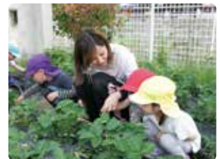
園庭の畑で園児たちといちご狩り

保育士は、子どもたちと、そして職場の仲間・先輩と一緒に成長していける素敵な仕事だと思います。私たちと一緒に、ぜひいろいろなことを楽しみながら学んでいきましょう。