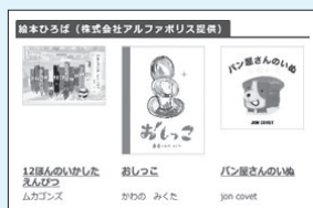
電子図書館内に新たに追加した「児童絵本」(電子書籍)の画面

この協定による絵本は、書籍としては販売されておらず、電子書籍でしか読むことができます。