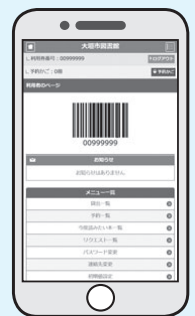
利用者のマイページ画面