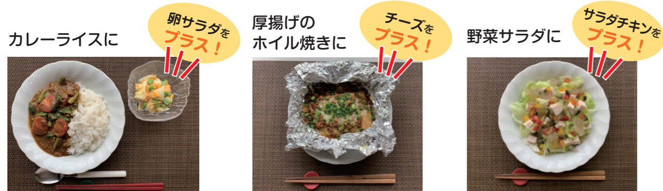
レシピ考案：岐阜女子大学健康栄養学科学学生

たんぱく質は、まとめてとるのではなく、毎食とることで、筋たんぱくを合成して、筋肉量を維持できます。