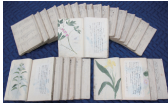
飯沼慈齋著「草木図説」草之部稿本（個人蔵、奥の細道むすびの地記念館預託）