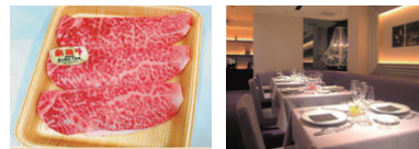
飛騨牛A5ランク ペア食事券