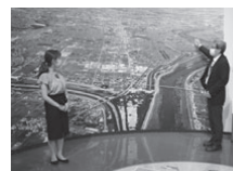
水難の歴史を紹介

<水都ピア通信おোগき> 月/15:45~、水/19:30~、金/17:15~、土/23:45~、日/14:45~ 「水とともに生きるまち 大垣」 市内各所にある井戸を巡りながら湧き水に触れ、輪中館などの施設見学やサイトピアセンター・水のパビリオンでの体験を通して、大垣の水に関する歴史などを紹介する。