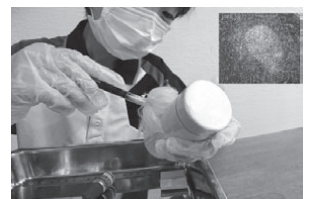
科学捜査の体験の様子