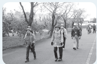
かがやきクラブ健康ウォーキングの様子

集めます。6ポイントたまると、県内各地の協力店でさまざまな特典を受けることができる「ミナモ健康カード」がもらえるほか、抽選で健康グッズや県産品なども当たります ❖ポイント対象メニュー／【必須】各種健康診査、各種検診（がん・肝炎ウイルス・骨粗しょう症など）の1つ以上の受診、【任意】市が指定する健康教室やイベントなどへの参加、自主的な健康づくり（栄養・運動・口腔に関する取り組み）、かがやきクラブの活動など ※メニューの詳細は市HPに掲載