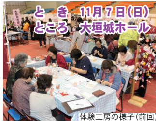
体験工房の様子(前回)