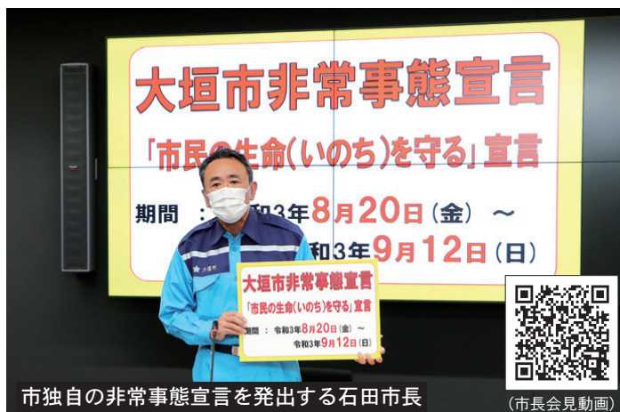
市独自の非常事態宣言を発出する石田市長

市民の皆さま、企業の皆さまには、さまざまな場面でご不便をおかけしますが、ここが我慢のしどころです。一人一人の行動自制で感染拡大を確実にストップさせたいという強い思いでの発出であり、皆さまのご理解とご協力が必要です。