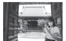
景観遺産をアプリを使って散策

景観遺産を楽しく巡ることができる「大垣市景観遺産・四季の里」アプリを活用して、モデルコースを散策しながら、大垣市景観遺産に指定された建築物や風景などを紹介する。