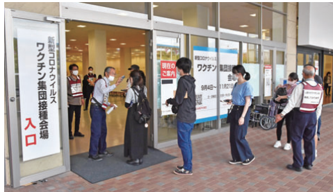
イオンタウン大垣の集団接種会場

新型コロナウイルスワクチンは、接種後、発熱などの副反応が現れることがあります。こうした症状の大部分は接種後数日