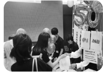
記念グッズの販売

大垣市社会福祉協議会は法人化50周年を迎えたことを記念して、職員によるワーキンググループを中心に式典やチャリティーゴルフ大会、50周年ビジョン策定等の記念事業の実施や記念誌を作成しました。式典や福祉ふれあいボランティアフェスティバルでは動画や展示で50年の歩みを紹介し、これまでの活動を振り返るとともにこれからの地域福祉のあり方を考える機会としました。 また、記念誌やロゴマーク、オリジナルグッズの制作、広報紙での特集等を通じて、市民の皆様幅広く50周年をお知らせしました。これらの取り組みを通して、多くの方にご参加・ご協力いただき、本会は新たな一歩を踏み出しました。これからも地域の皆様とともに歩んでいきます。