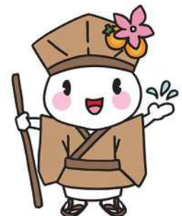
大垣市マスコットキャラクター おがっきい

※このほかにも条件がありますので、設置工事のご契約前に建築指導課まで お問合せ下さい。