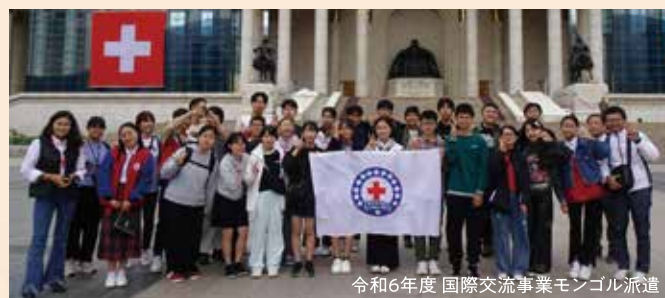
令和6年度 国際交流事業モンゴル派遣