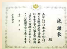
厚生労働大臣感謝状

※分納の場合は、初回寄付の前に、予め分納のご意志をお伝えいただく必要があります。