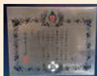
銀色有功章 (個人・法人)