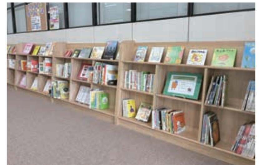
東地区センターの地域文庫