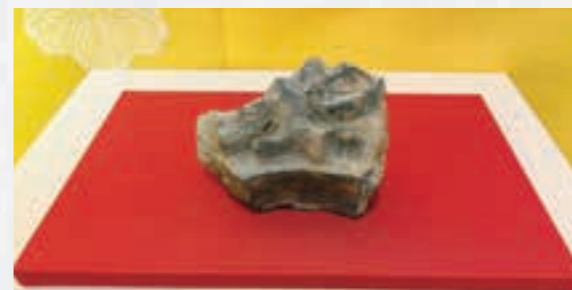
大垣城企画展 金箔瓦(大垣城出土)