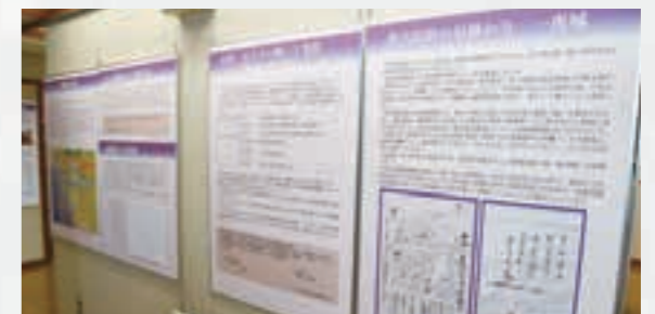
墨俣一夜城企画展の様子