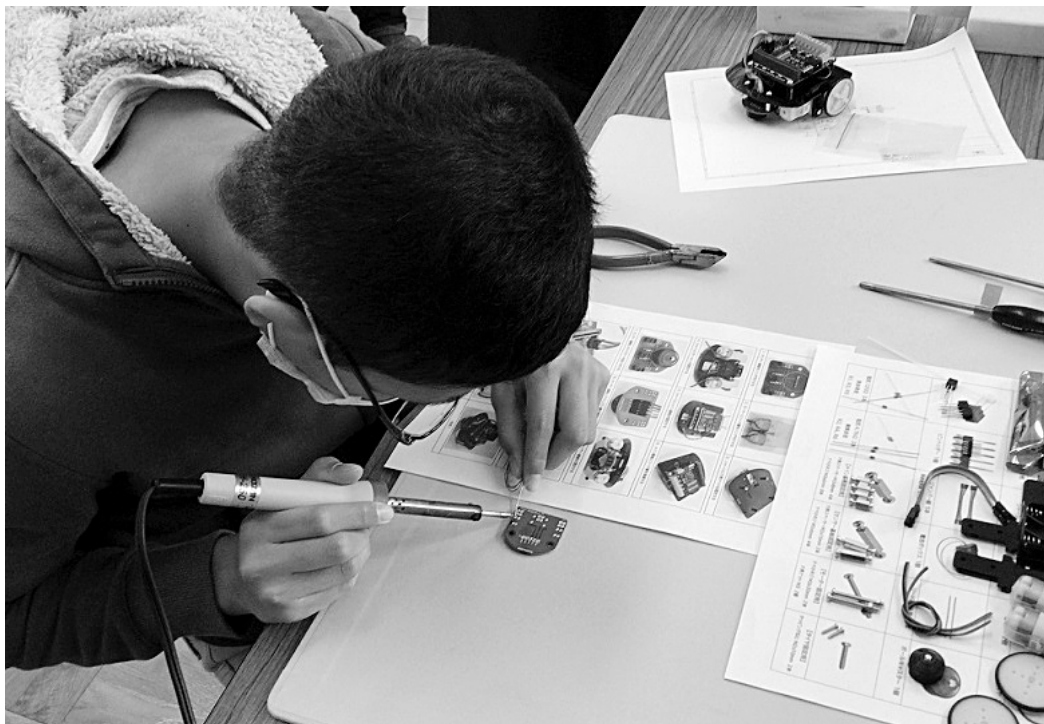
大垣市こどもICT講座「ロボットカープログラミング講座」