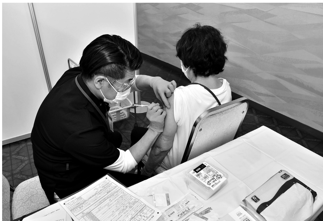
新型コロナウイルスワクチン集団接種（大垣市民会館）