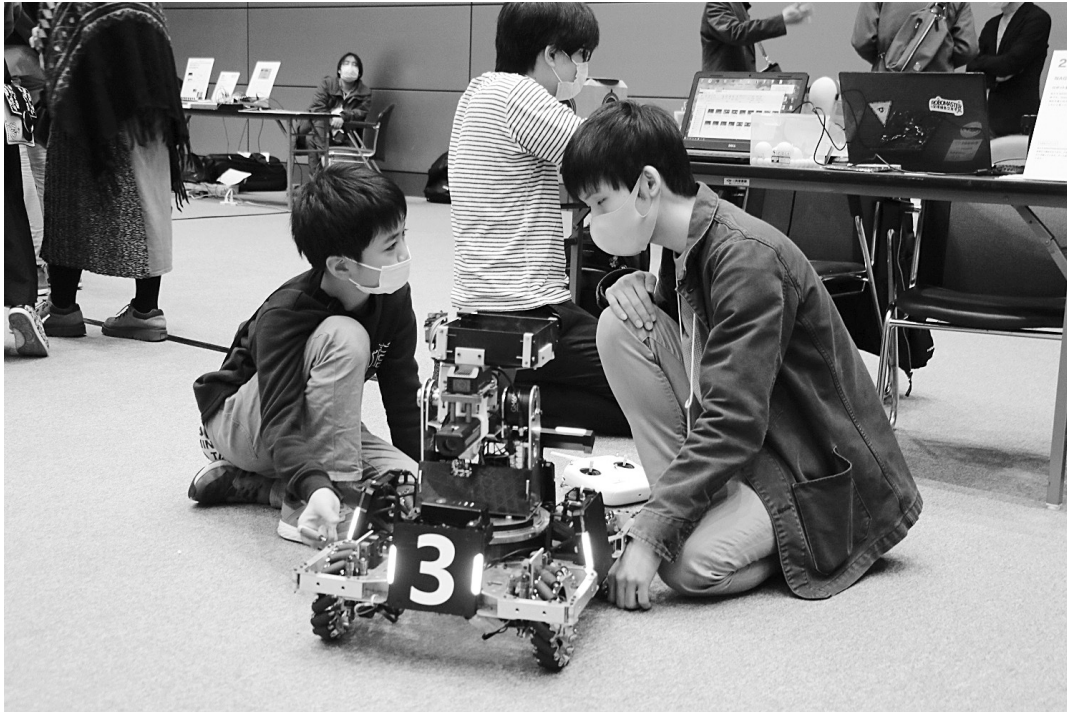
Ogaki Mini Maker Faire