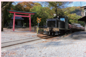
風景資産 ▶石引神社と西濃鉄道の線路（赤坂町）