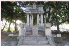
風景資産 ▶大垣消防組員顕徳碑（郭町）