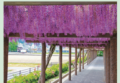
風景資産 ▶赤坂スポーツ公園のフジ（草道島町）