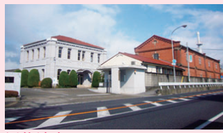
近代遺産 ▶三甲テキスタイル株式会社 レンガ倉庫と洋館（室村町）