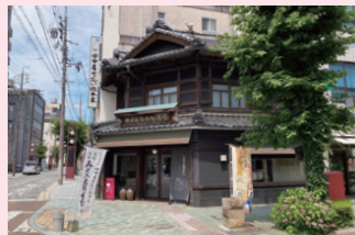
歴史文化遺産 ▶田中屋せんべい総本家（本町）