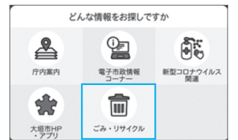
市LINEの「ごみ・リサイクル」情報