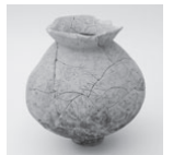
東町田墳墓群出土絵土器