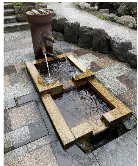
井戸舟設置のイメージ