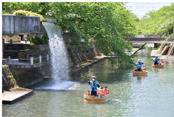
ウォーターカーテンなどの景観を楽しめる「四季の広場」