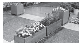
事業を利用して設置された花壇