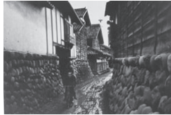
堤外地の盛土住居