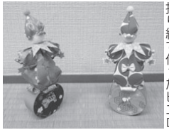
折り紙で作ったピエロ