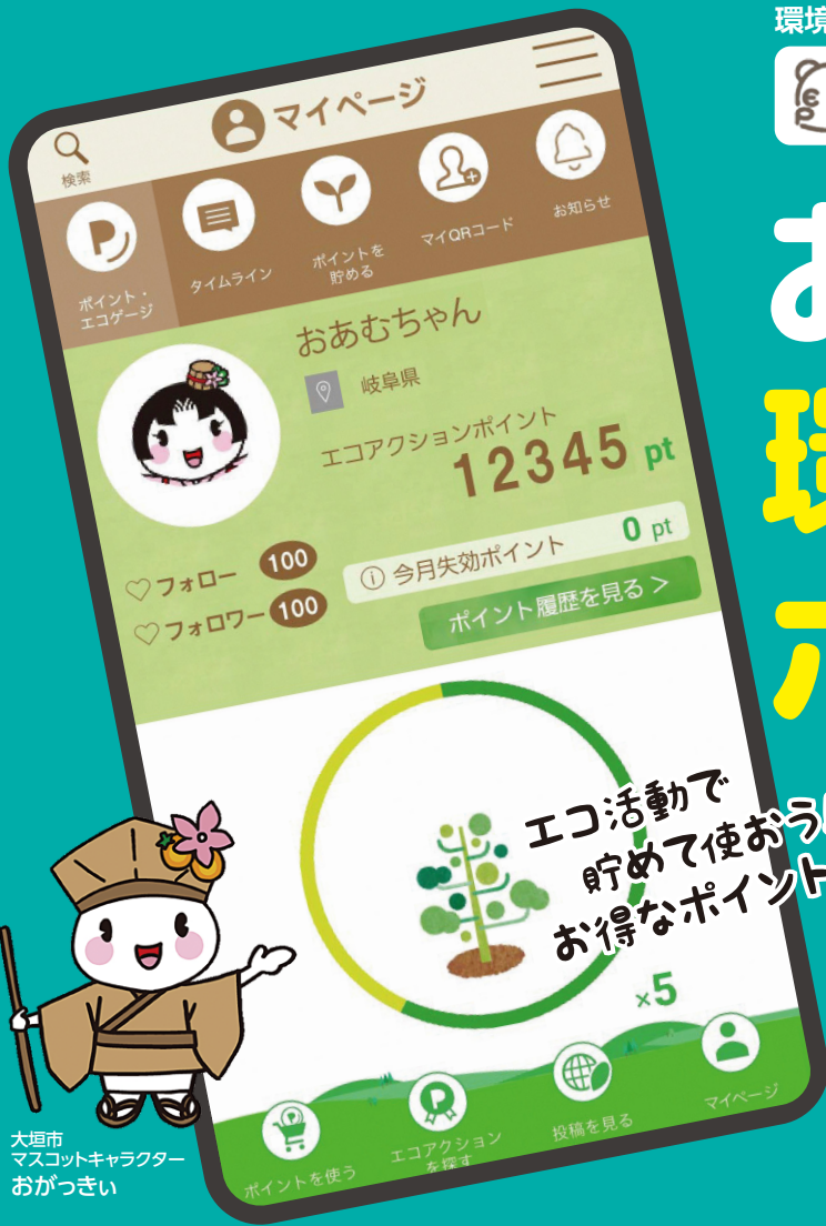
大垣市 マスコットキャラクター おおがきい