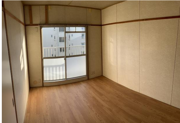
和 室 ①