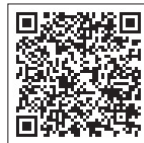
日本政策金融公庫HP