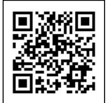
HP do Ogaki Matsuri

Maiores informações no Comitê Executivo do Festival Ogaki (dentro da Associação de Turismo da Cidade de Ogaki ☎0584-77-1535).